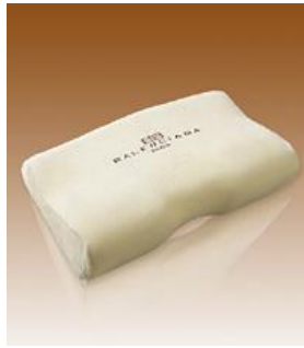
メモリーフォーム